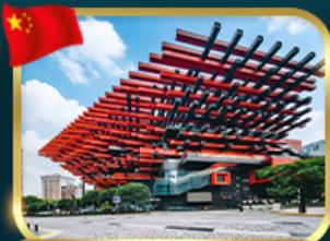
แลนด์มาร์กจั๊ว ตึกตะเกียบ