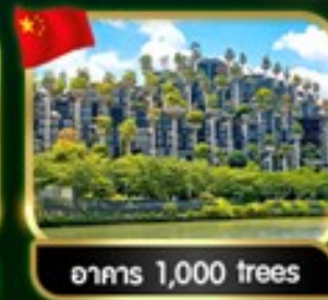
อาคาร 1,000 trees