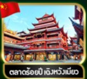
ตลาดร้อยปี เจิวหวงเหมียว