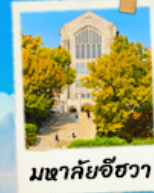
มหาชัยชีวา