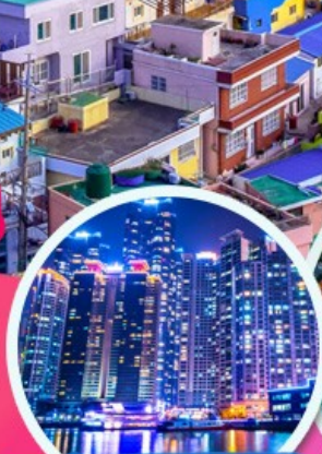
The Bay 101