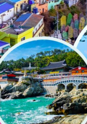
วัดนฮดง ยงกุงซา