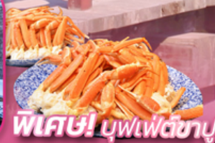
พิเศษ! บุฟเฟ่ต์ซาซิมิ