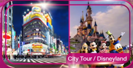
City Tour / Disneyland