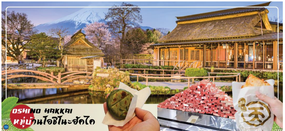
OSHINO HAKKAI หมู่บ้านโอชิโนะซัคโค

ได้เวลาอันสมควรนำท่านเดินทางสู่ จังหวัดยามานาชิ (Yamanashi) (ใช้เวลาเดินทางประมาณ 2-3 ชั่วโมง) นำท่านเดินทางสู่ หมู่บ้านโอชิโนะซัคโค (Oshino Hakkai) ให้ท่านเจาะลึกตามหาแหล่งน้ำบริสุทธิ์จากภูเขาไฟฟูจิ ที่เป็นแหล่งน้ำตามธรรมชาติตั้งอยู่ในหมู่บ้านโอชิโนะ จ.ยามานาชิ หรือพูดในทางกลับกันคือกลุ่มน้ำผุดโอชิโนะซัคโค เพียงก้าวแรกที่ย่างเท้าเข้าไปในหมู่บ้านก็สัมผัสได้ถึงอากาศบริสุทธิ์ และไอเย็นจากแหล่งน้ำธรรมชาติที่มีให้เห็นอยู่ทุกมุม โดยในบ่อน้ำใสแจ๋วมีปลาหลากหลายพันธุ์แหวกว่ายอย่างสบายอารมณ์ แต่ขอบอกเลยว่าน้ำแต่ละบ่อนั้นเย็นจับใจจนแอบสงสัยว่าบ่อน้ำปลาไม่หนาวสะท้านกันบ้างหรือ เพราะอุณหภูมิในน้ำเฉลี่ยอยู่ที่ 10-12 องศาเซลเซียสนอกจากชมแล้วก็ยังมิน้ำผุดจากธรรมชาติให้ดื่มตามอัธยาศัย และที่สำคัญ หมู่บ้านโอชิโนะยังเป็นแหล่งช้อปปิ้งสินค้าโอท็อปชั้นเยี่ยมอีกด้วย