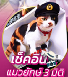
เช็กอิน แมวยักษ์ 3 มิติ