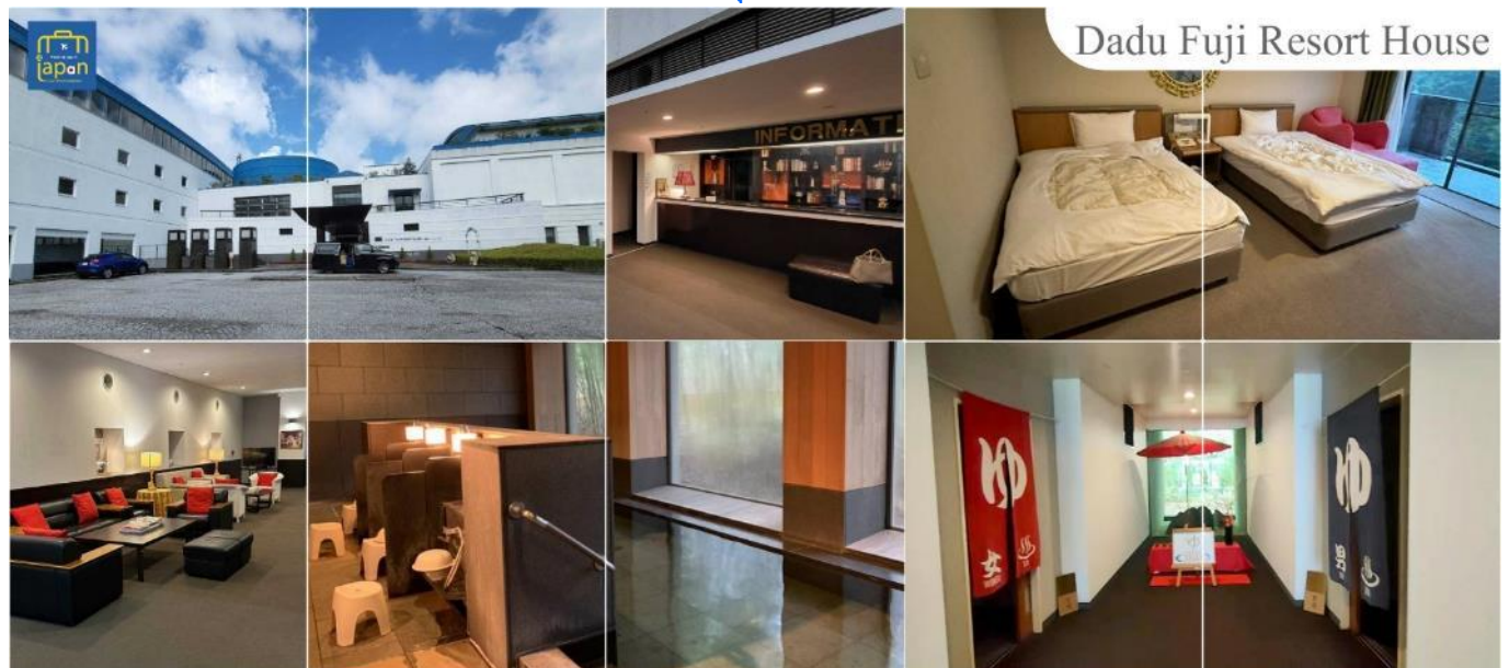
Dadu Fuji Resort House

หลังอาหารให้ท่านได้ผ่อนคลายกับการแช่น้ำแร่ธรรมชาติ เชื่อว่าถ้าได้แช่น้ำแร่แล้ว จะทำให้ผิวพรรณสวยงามและช่วยให้ระบบหมุนเวียนโลหิตดีขึ้น