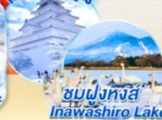
ชมฝูงหงส์ Inawashiro Lake