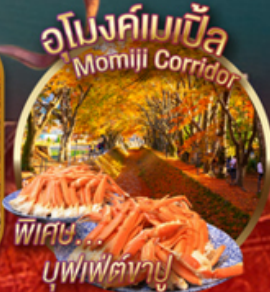
พิเศษ บูฟเฟ่ต์ปู

📍 ระวัง!! สะดุดตาไปกับ ใบไม้เปลี่ยนสี สดใส ณ อุโมงค์เมบิล หรือ โมบิจิ คามิโคจิ หุบเขาในฝันที่อยู่สูงขึ้นไปทางเหนือของเทือกเขาแอลป์ ญี่ปุ่น นั่งกระเช้า คาชิ คาชิ ชมความสวยงามของทะเลสาบควาคุจิโกะจากมุมสูง ล่องเรือโจรสลัด ณ ทะเลสาบอาชิ และ พาซิม ไร่ดำ ณ หุบเขาโอวาคุดานิ