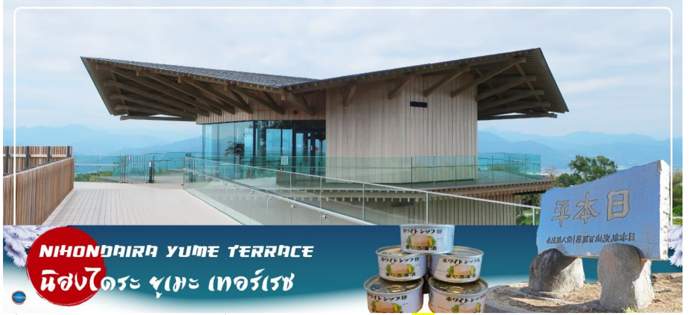
NIHONDAIRA YUME TERRACE นิสงไดระ ยูเมะ เทอร์เรซ