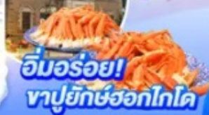
อิมมอร์ออย! ทาปูยักษ์ฮอกไกโด