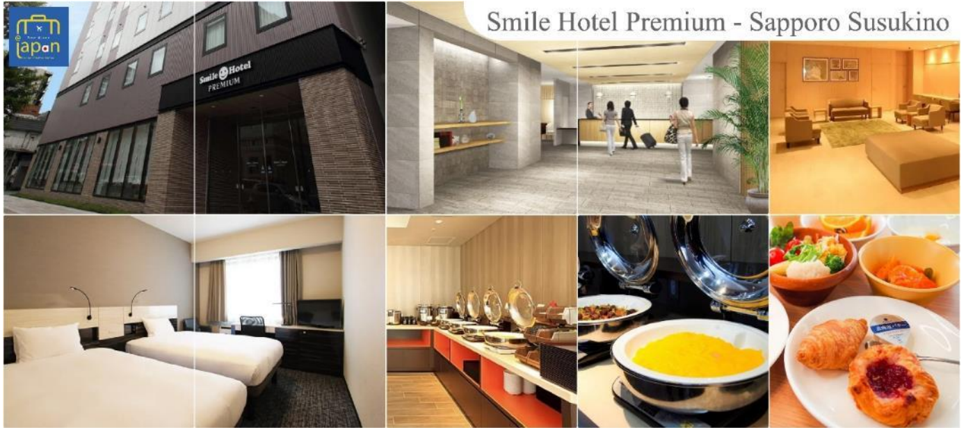
Smile Hotel Premium - Sapporo Susukino

รับประทานอาหารเย็น ณ ภัตตาคาร (3) พิเศษ!!! เมนู บุฟเฟต์ซาซิมิ + ซาซิมิ SMILE HOTEL PREMIUM - SAPPORO SUSUKINO หรือเทียบเท่าระดับเดียวกัน