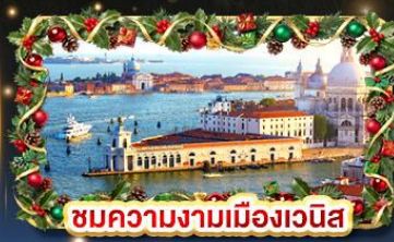
ชมความงามเมืองเวนิส