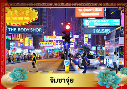
จิมซาจุ่ย