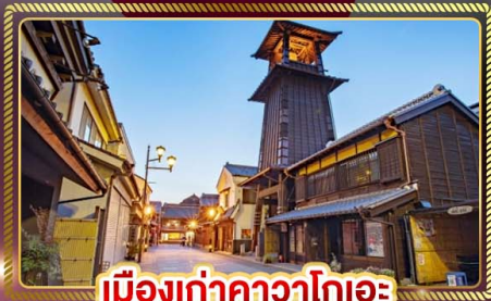
เมืองเก่าคาวาโกเอะ