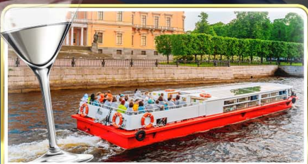
ล่องเรือแม่น้ำเนวา พร้อมเสิร์ฟ Vodka Tasting

📅 เดินทาง : 14-21 มิ.ย.69 / 28 มิ.ย.-05 ก.ค.69 / 24-31 ก.ค.69