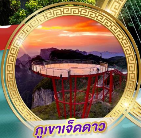
ภูเขาจี้ดดาว