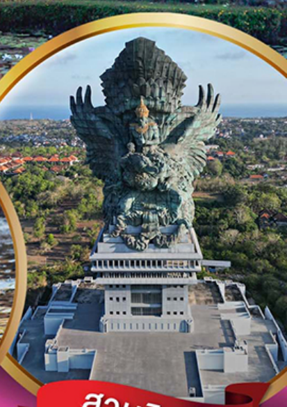
สวนวิชฌนุ