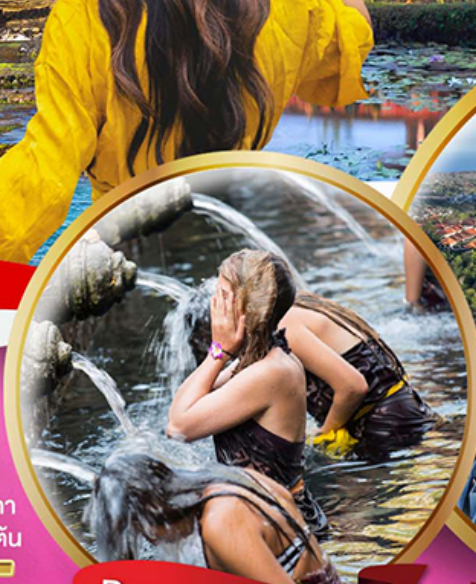
Pura Tirta Empul