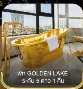
พัก GOLDEN LAKE ระดับ 5 ดาว 1 คืน