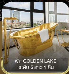
พัก GOLDEN LAKE ระดับ 5 ดาว 1 คืน