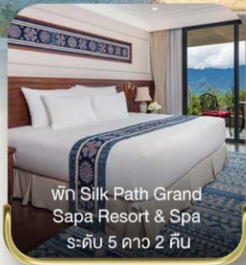
พัก Silk Path Grand Sapa Resort & Spa ระดับ 5 ดาว 2 คืน