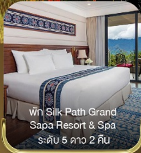
พัก Silk Path Grand Sapa Resort & Spa ระดับ 5 ดาว 2 คืน