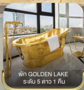
พัก GOLDEN LAKE ระดับ 5 ดาว 1 คืน

Premium Program บิหารุ เทียวครบ | 4 วัน 3 คืน