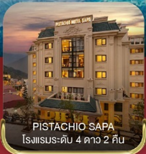
PISTACHIO SAPA โรงแรมระดับ 4 ดาว 2 คืน