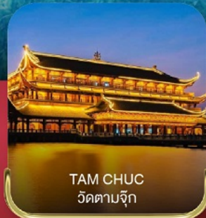
TAM CHUC วัดตามจุก