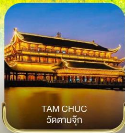
TAM CHUC วัดตามจุก