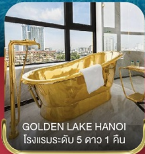
GOLDEN LAKE HANOI โรงแรมระดับ 5 ดาว 1 คืน