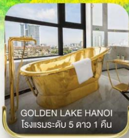
GOLDEN LAKE HANOI โรงแรมระดับ 5 ดาว 1 คืน