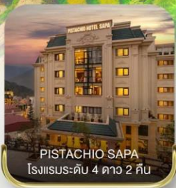
PISTACHIO SAPA โรงแรมระดับ 4 ดาว 2 คืน