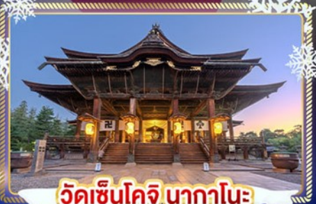
วัดเซ็นโคจิ นากาโนะ