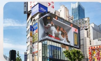
ซูปป์ิงชินจูกุ