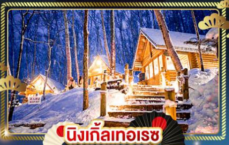
นิงเกิ้ลทอริช