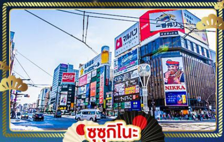
ซูซุกิโนะ