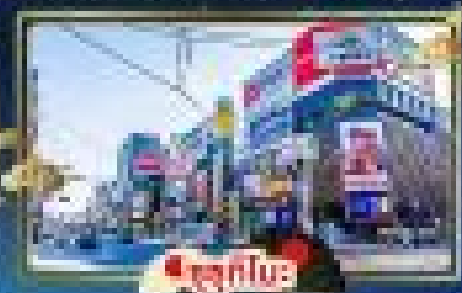
🏙️ ซัปโปโระ