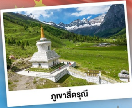
กุเวาสีครุณี

เที่ยว 2 อุทยาน กุเวาสีครุณี & ปี้ฝิงโกว เดินชมหมีแพนด้าสุดน่ารัก ใกล้ชิดกับแพนด้าแดง