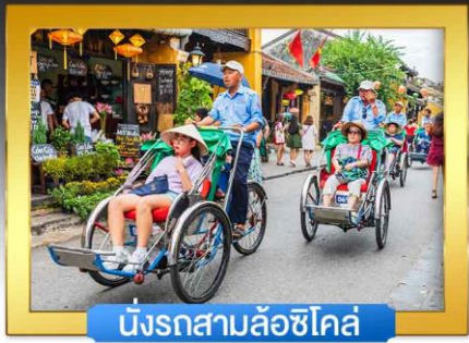
นั่งรถสามล้อชิโคล์