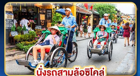
นั่งรถสามล้อฮิโคล่