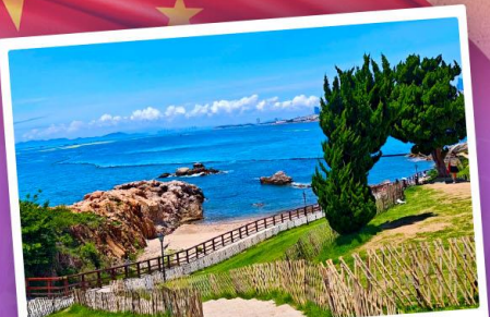
เกาะเสี่ยวมายเต่า

เที่ยวชิงเต่า เมืองทะเลสุดชิล ครบทั้งกิน เที่ยว ถ่ายรูป