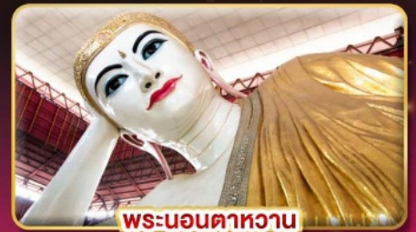
พระนอนตาทหวา