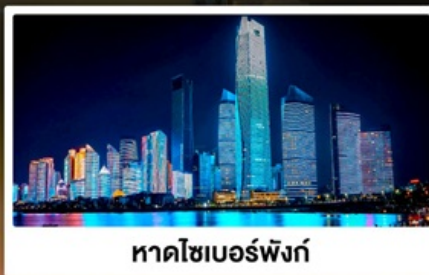
หาดไซเบอร์ฟิงก์