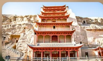
ถ้ำม่อเกาคุ