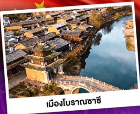
เมืองโบราณซาซี

ชมดอกไม้บานสะพรั่งที่ยุENNาน "เซ็ดอี่แฉดาเฟ้ววี่สุดอี่ง"