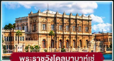
พระราชวังโดลมาบาห์เซ่