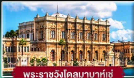
พระราชวังโดลมาบาห์เซ่

สัมพัสดินแดน 2 ทวีป ตุรเดียง ฟรี! ไอศกรีมท่านละ 1 SCOOP