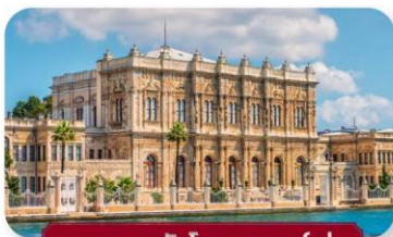
พระราชวังโดลมาบาห์เซ่