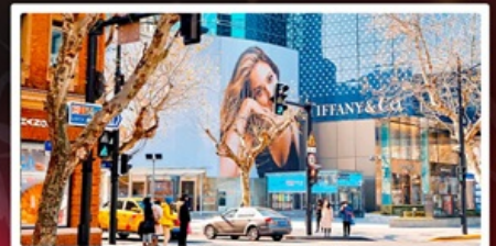
ถนนหวยไห่มีดัดส์โรด