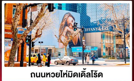
ถนนหวยไห่มีดเค็ลโรัด