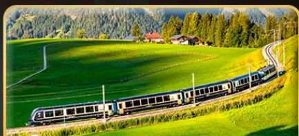
นั่งรถไฟสายโรเมนติก 2 สาย Golden Pass / Luzern Interlaken Express