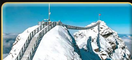
พิชิต 3 ยอดเขาดัง Rigi / Schilthorn / Glacier 3000