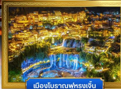
เมืองโบราณฟูหลงเจิ้น