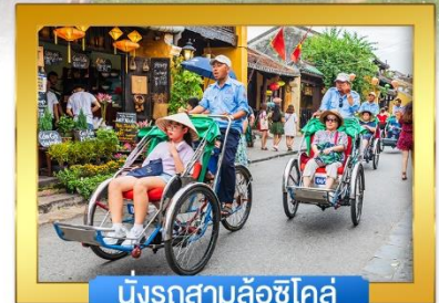
นั่งรถสามล้อซิโคล