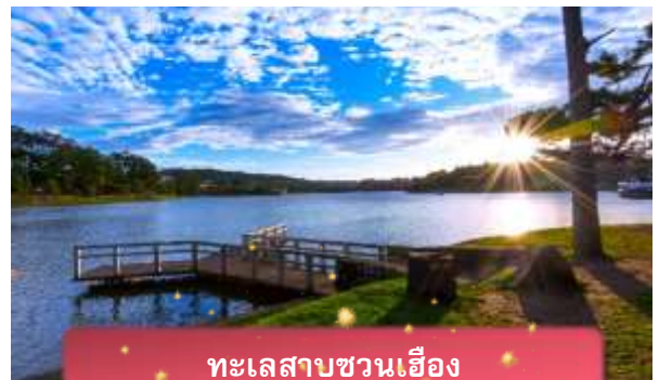
ทะเลสาบชวนเอื้อง

ที่พัก The Western Hill ระดับ 4 ดาวหรือเทียบเท่า