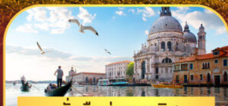
นั่งเรือสุกาะเวนิส