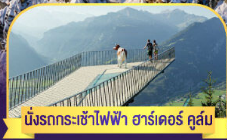
นั่งรถกระเช้าไฟฟ้า ชาร์เตอร์ ดูล์ม