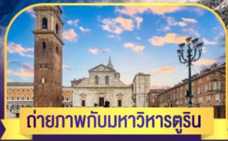
ถ่ายภาพกับมหาวิหารตูริน