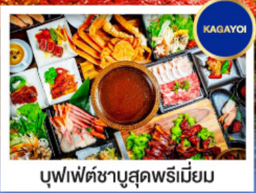
บุฟเฟ่ต์ซาบุดะพรหมเมียม