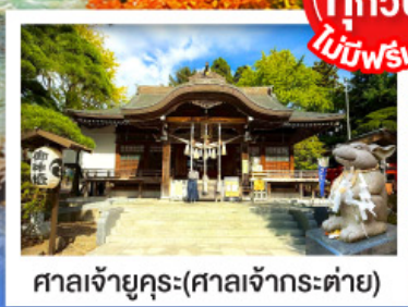
ศาลเจ้าคุระ (ศาลเจ้ากระต่าย)

พิเศษบุฟเฟ่ต์ซาบุดะพรหมเมียม ปูออกโทโด อาหารทะเล เนื้อวากิว สเต็ก ซูชิอิสระ และเครื่องดื่มไม่อัน