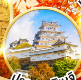
ปราสาทโอเมจิ