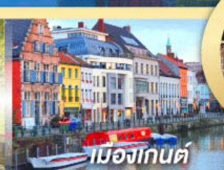
เมืองกันต์