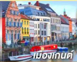
เมืองกันต์