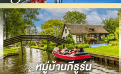
หมู่บ้านทีร์รูน