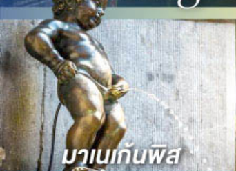
มานเนกันพิส