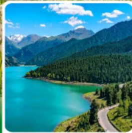
อุทยานเทียนซาน เทียนฉือ