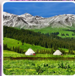
ทุ่งหญ้านาลาติ