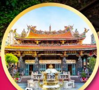
วัดหลงซาน