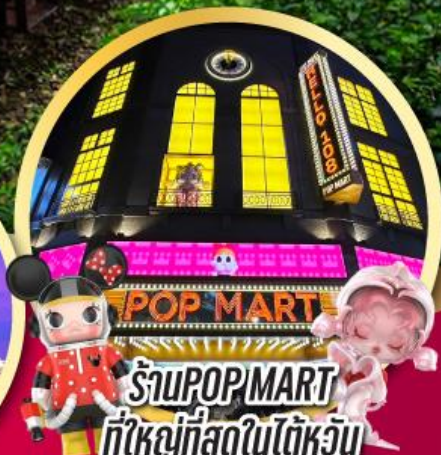
ร้าน POP MART ที่ใหญ่ที่สุดในไต้หวัน