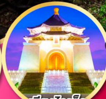
เจียงไคเช็ค