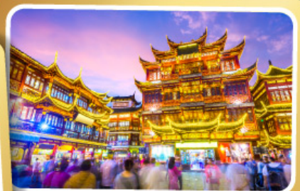
ตลาดร้อยปีเจียงหวงเมี่ยว

สนุกสนานไปกับเครื่องเล่น Shanghai Disneyland เต็มวัน