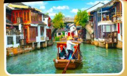
เมืองโบราณจูเจียเจียว