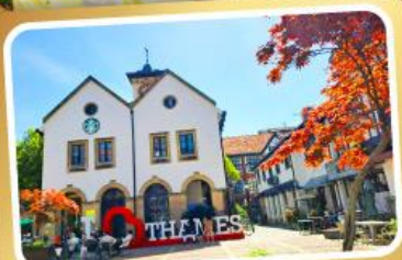
เกมส์ทาวน์