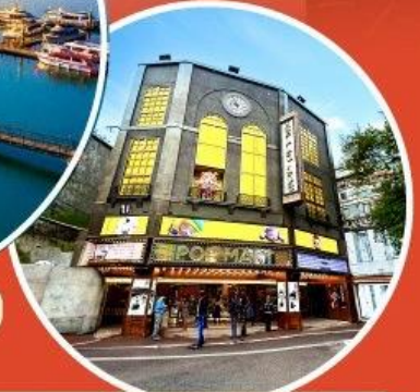
ร้าน POP MART ใหญ่ที่สุดในไต้หวัน