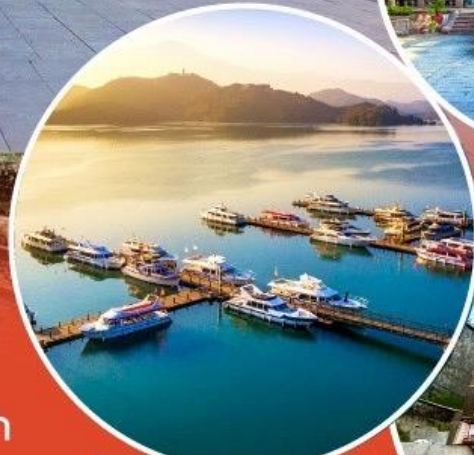
ทะเลสาบสุริยขึ้นจันทรา