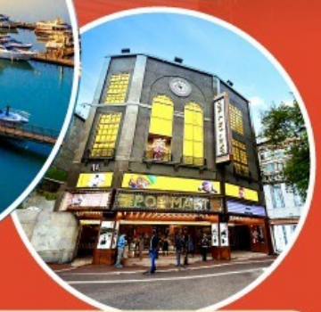
ร้าน POP MART ใหญ่ที่สุดในไต้หวัน