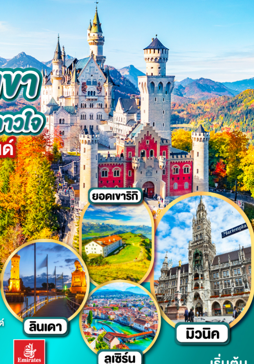
ยอดเขารีกี