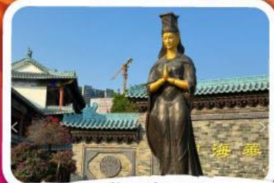
• วัดเจ้าแม่กัทิม