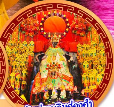
เจ้าแม่กวนอิมฮ่องฮำ

นมัสการเจ้าแม่กวนอิมฮ่องฮำ หมุนกั้งหันรับโชคลากเงินทองที่วัดแชกงหมีจ ขอพรความรักกับผู้เฒ่าจันตรา วัดหวังต้าเซียน