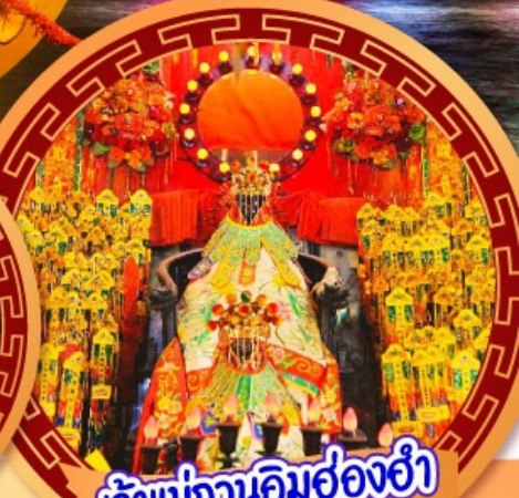
เจ้าแม่กวนอิมฮ่องฮ่า

นมัสการเจ้าแม่กวนอิมฮ่องฮ่า หมุนกังหันรับโชคลากเงินทองที่วัดแชงหมิว ขอพรความรักกับผู้เฒ่าจันทรธา วัดหวังต้าเซียน