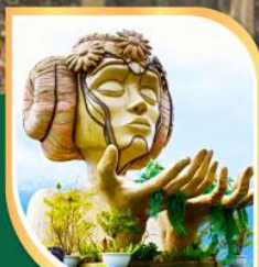
โมอาน่า ซาปา คาเฟ่