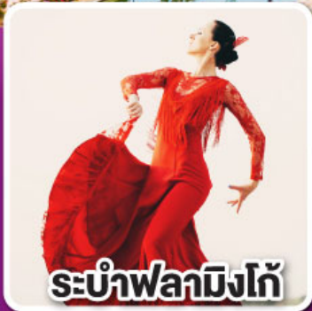
ระบำฟลามิงโก้

ล่องเรือชมความน่ารัก ตามธรรมชาติของฝูงโลมา