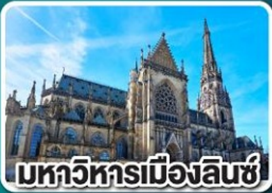
มหาวิหารเมืองลินซ์