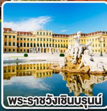
พระราชวังเซินบรุนน์

บินตรงไปกลับ ด้วยสายการบินชั้นนำระดับ 4 ดาว คูปองอาหารเช้าและออสเตรียนแอร์ไลน์