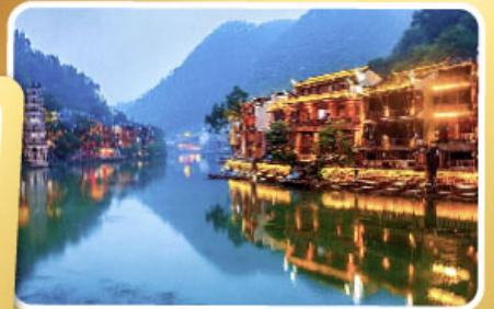
เมืองโบราณฟิ่งหวง