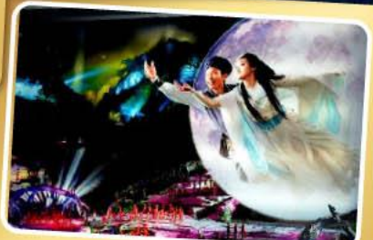
โชว์จิ้งจอกขาว